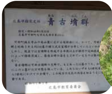
青古墳群の横穴式石室