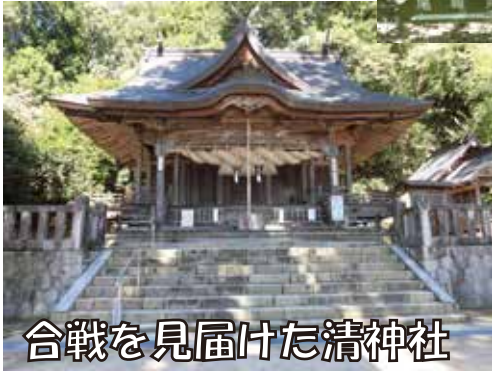
合戦を見届けた清神社