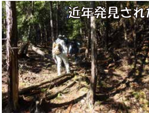
近年発見された陣城跡も