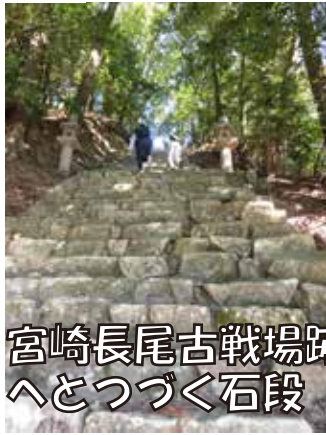
宮崎長尾古戦場跡へとつづく石段