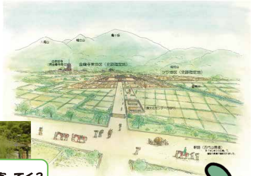
はじまりの広場の標識