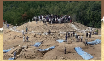
宮ノ本古墳群(三次市)現地説明会(2007)

今回は「考古学おいでまいど」と題して、これまで聴講された皆様のアンケートで、要望の多かったテーマや事柄を焦点に開催します。どうぞお気軽にお越しください。