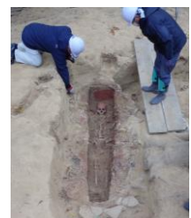
第2号墳 （箱式石棺）作業風景