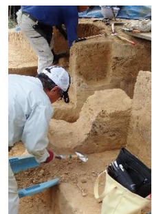
第3号墳 （木棺墓）作業風景