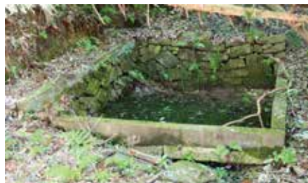
白山城跡の井戸・城河 (じょうのかわ)