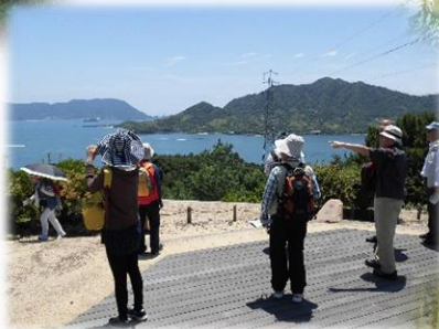
展望台からの眺め