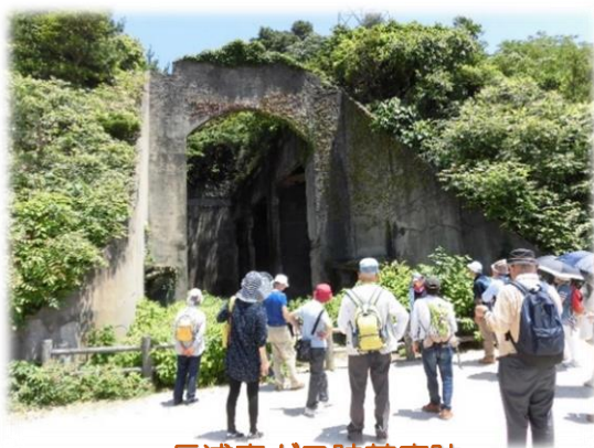
長浦毒ガス貯蔵庫跡