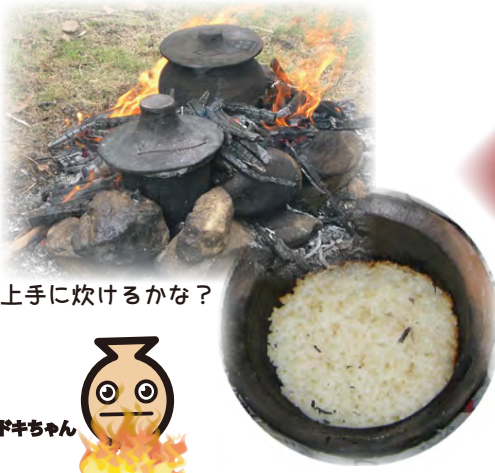
上手に炊けるかな？