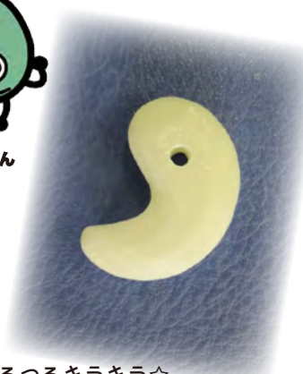
つるつるキラキラ☆