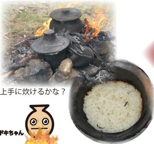
上手に炊けるかな？