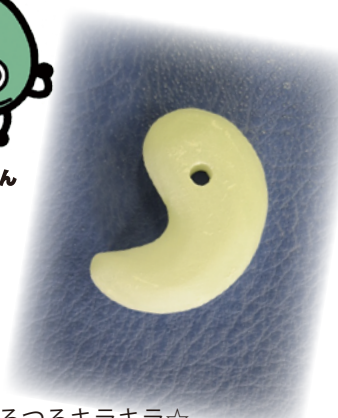
つるつるキラキラ☆