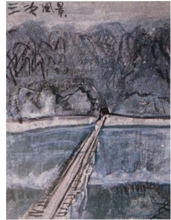
尾関山をぬける三江線の線路